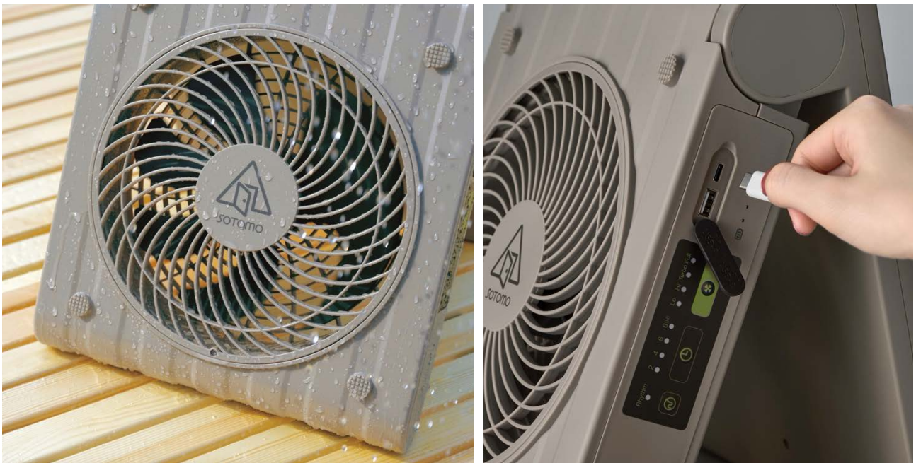
図2 各部説明（左：防水イメージ、右：USB PD 出力）

さらに、持ち運び用の専用収納袋も付属しており「家でもソトでも使える」をより便利にするセットにしています。