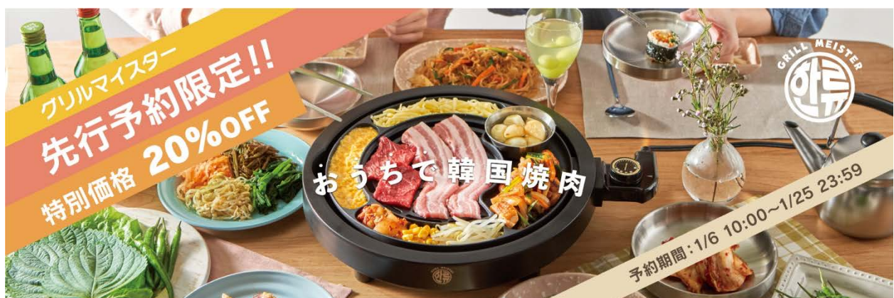
図4 セール告知バナー