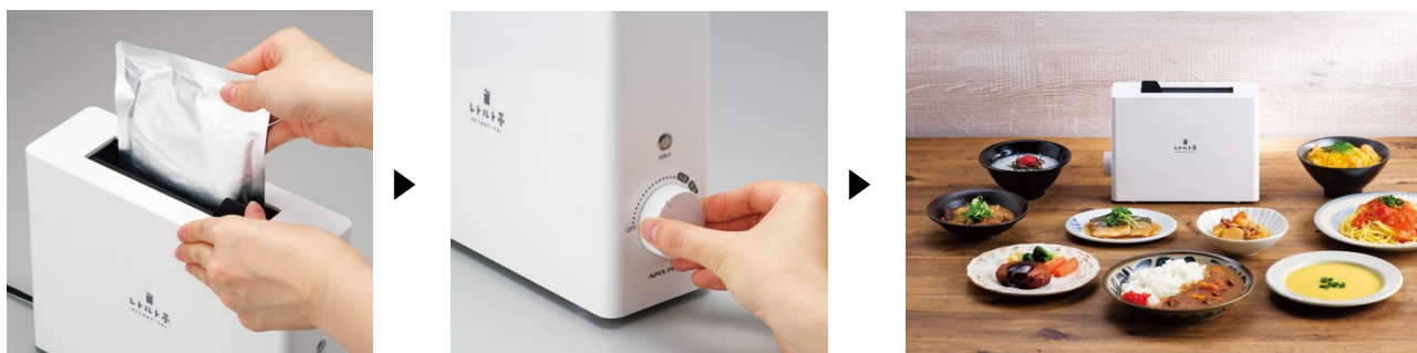
図4 レトルト亭の操作方法

レトルト亭の操作方法は、レトルト食品をパウチのまま本体に挿入して、食品の容量に応じて「小盛」「普通」「大盛」までダイヤルを回すだけ。あとは出来上がりのベルを待てば、温かいレトルト食品が出来上がります。