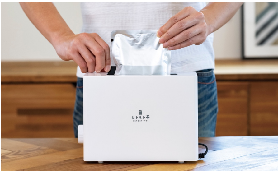
図1 パウチを入れる様子

デザイン家電・雑貨メーカーの株式会社アピックスインターナショナル（本社：大阪府大阪市、代表取締役社長：木地好美、以下アピックス）は、レトルト専用調理器「レトルト亭」（ARM-110）を1月下旬より発売いたします。