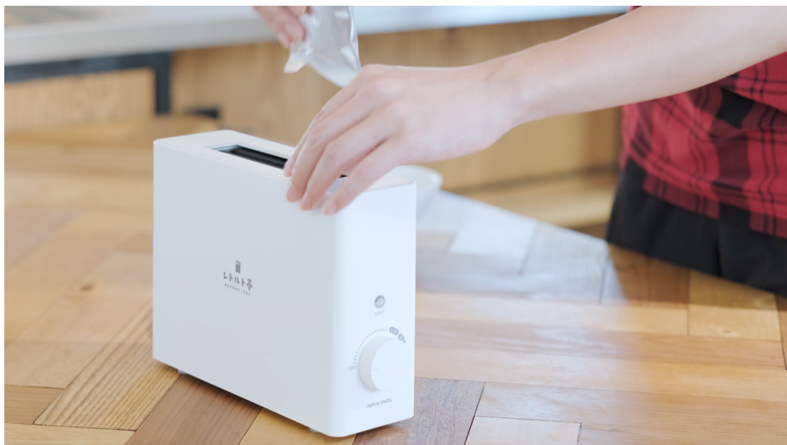
図2 忙しい朝もパウチを入れてダイヤルを回すだけ