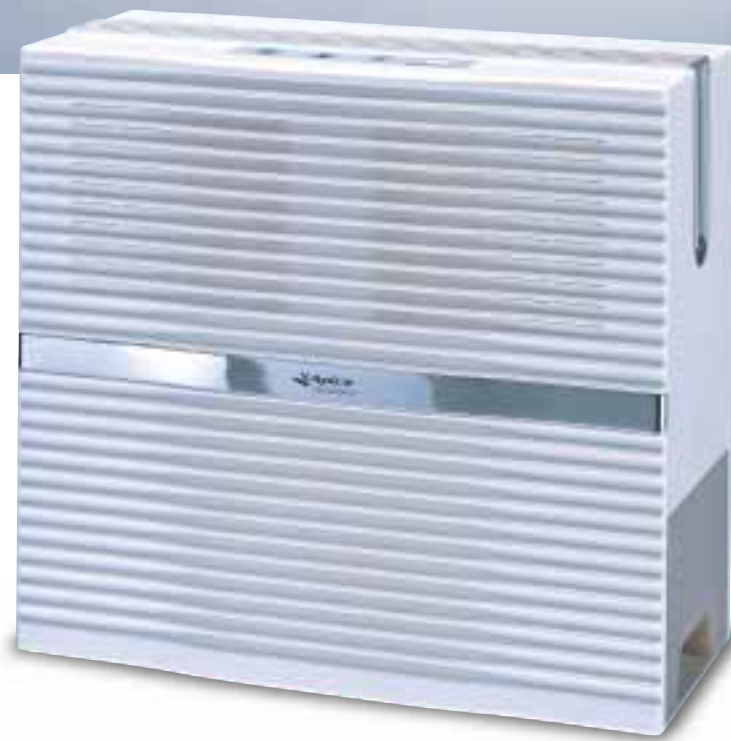
ホワイト×シルバー